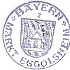
Claus Schwarzmann 1. Bürgermeister